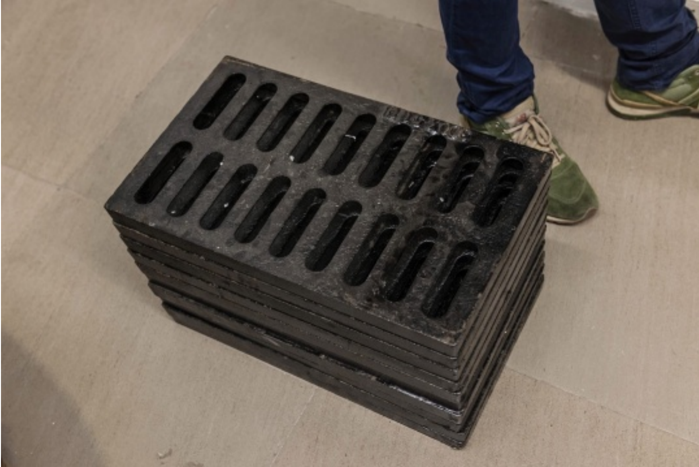
展厅的下水道井盖，与不远处仙人掌呼应的

就在刚刚那面巨大的镜子之下，金属管、下水井盖之间夹着标志性仙人掌，在工业、建材等无机物之间，更显光滑、感性、生机勃勃，却也让人感到危险。与之相对的展墙上，覆盖着一张折叠后的金属锡纸，而原有展墙上的空洞被揉搓的锡纸堵塞。由于折痕的存在，锡纸变得更加柔软、飘逸，可是它又真的改变了吗？