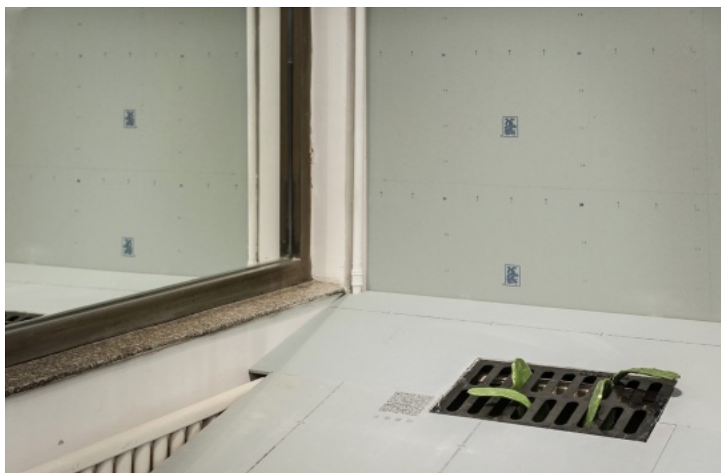
窗上镜面扩充了室内的空间，但外侧的镜子又对其进行挤压

在此次展览中，望远镜艺术家工作室墙上原有的石膏被保留，艺术家借助新的建材在空间内搭建了斜坡，毫无疑问，建材成了她的画布，这也是她一贯的创作手法。房间的玻璃被替换为两篇“背靠背”的镜面，屋内的空间得以向外拓展，但外侧的玻璃又对空间进行着碰撞和挤压。