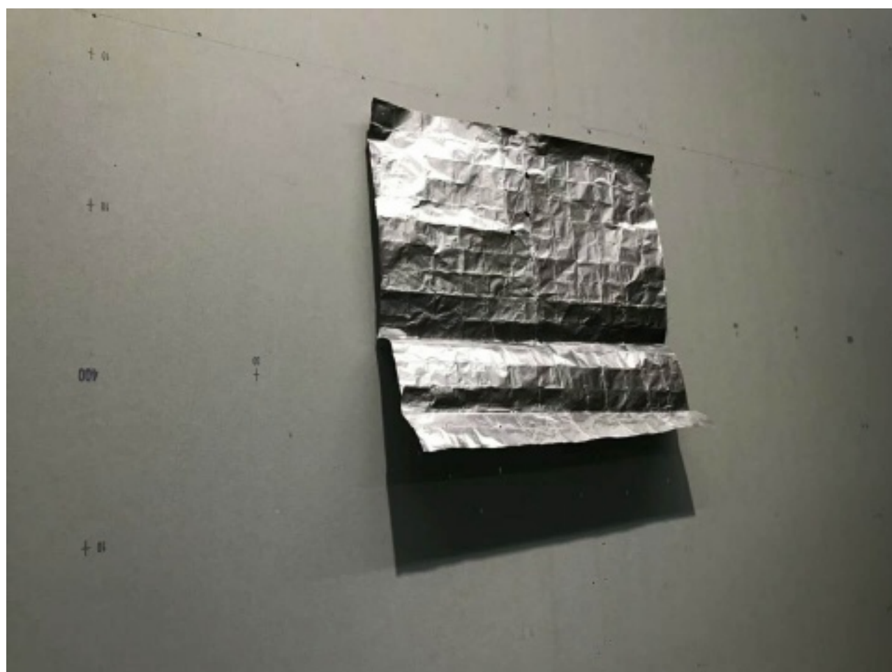
墙上“飘逸”的金属锡纸